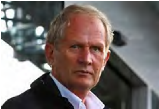
Dr. Helmut Marko